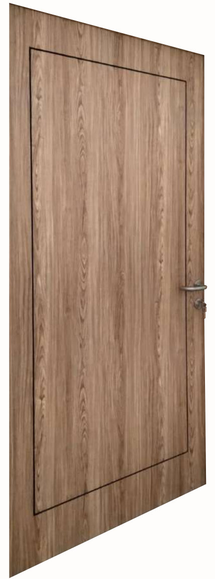
LAPISAN PVC SHEET

Pintu SWP (Solid Wood Panel) telah menjadi pilihan favorit di kalangan masyarakat berkat berbagai keunggulan yang ditawarkannya, termasuk tampilan elegan, ketahanan yang luar biasa, dan keindahan kayu asli yang dimiliki pintu SWP.